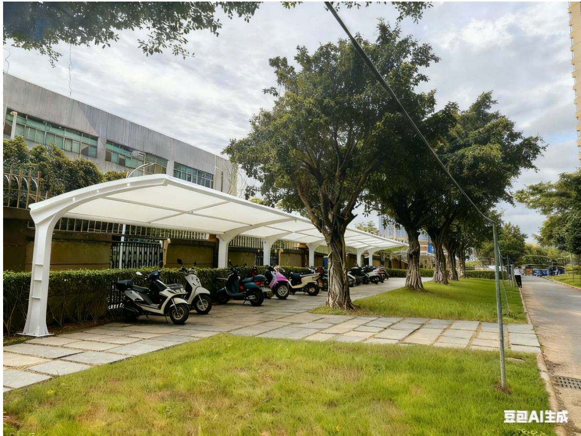
位置十：16、29 栋前方，覆盖范围 16、29 栋，预计可停放 90-100 辆电动车